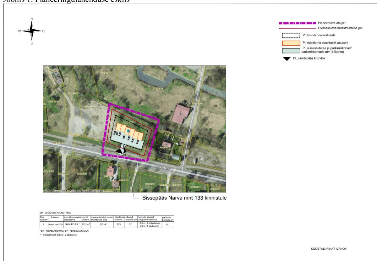
Joonis 1. Planeeringulahenduse eskiis